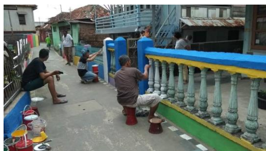
Gambar 8. Bapak-bapak sedang gotong royong mengecat pagar warga

Perusahaan menyediakan uang dan barang. Dana ini merupakan permintaan masyarakat untuk memperbaiki infrastruktur seperti pembelian cat dan pembelian barang-barang kebutuhan perpustakaan “Pojok Baca” masyarakat. Sedangkan barang yang disediakan perusahaan pada dasarnya merupakan limbah usaha yang sudah tidak dapat dimanfaatkan lagi. Namun limbah non-B3 dapat didaur ulang dengan aman, seperti kaleng bekas, palet kayu, dan wadah makanan Kemplang yang diproduksi di gudang kilang. (Lurah, 2023).