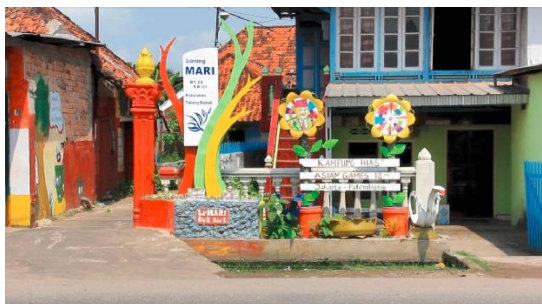
Gambar 5. Tampak Gerbang Lorong Mari

masyarakat untuk melakukan inovasi agar tidak menjadi daerah kumuh. Dengan demikian, tercipta solidaritas masyarakat untuk melakukan kegiatan yang bertujuan memajukan desa. Keberhasilan suatu program pemberdayaan tidak hanya bergantung pada siapa yang memprakarsai atau siapa yang paling berkontribusi. Keberhasilan suatu program pemberdayaan memerlukan perhatian terhadap prinsip-prinsip pemberdayaan. Apabila seluruh prinsip dihormati maka program dapat dikatakan berhasil.