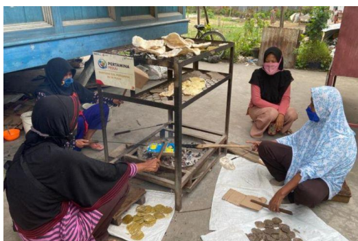
Gambar 7. Memanggang kemplang tunu

ini. Kesetaraan tidak berarti sama, dalam konteks Lorong Mari kesetaraan dikonstruksikan untuk mencakup program-program tanpa memandang perbedaan gender. Kegiatan yang dilakukan tidak sama namun terlihat pembagian tugas berdasarkan kompetensi yang dimiliki. Contohnya perempuan yang mengikuti aktivitas pengolahan makanan kemplang dan tergabung dalam kelompok Mari Kemplang. Sedangkan laki-laki ikut serta mengkonversi barang tidak pakai menjadi furnitur yang bernilai ekonomi tinggi dan tergabung dalam kelompok Ayo Bekerja. Seperti yang dikatakan perwakilan perusahaan: Program Desa Kreatif yang penuh warna menawarkan berbagai kegiatan seperti pendidikan, keterampilan, kesehatan dan kegiatan usaha kecil dan menengah. Di sini, peran komunitas berbeda-beda. Terkait gender, kami bekerja sama dengan masyarakat mendirikan Grup Mari Kemplang untuk kelompok yang mengolah makanan khas Palembang dan Grup Mari Berkarya untuk kelompok yang mengolah barang bekas menjadi furnitur yang bernilai ekonomi tinggi. Kelompok Mari Kemplang beranggotakan perempuan dan kelompok Mari Berkarya beranggotakan laki-laki.