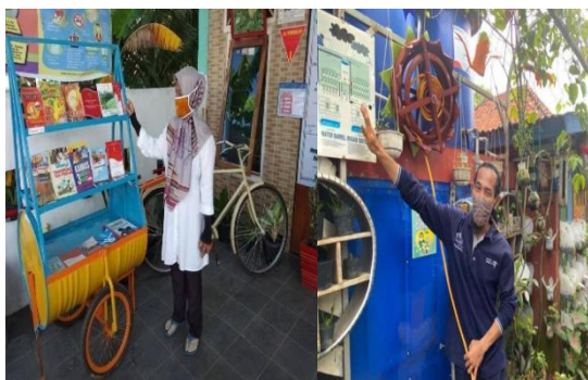
Gambar 6. Program Kreativitas dan olah bahan bekas

Secara prinsip ada empat pemberdayaan masyarakat, antara lain prinsip kesetaraan, prinsip partisipasi, prinsip otonomi, dan prinsip keberlanjutan. Pertama, prinsip kesetaraan merupakan prinsip utama yang harus diterapkan dalam proses atau kegiatan pemberdayaan. Prinsip ini berlaku baik antara masyarakat dan organisasi penyelenggara program maupun antara laki-laki dan perempuan. Dengan demikian pada hakikatnya setiap orang mempunyai kesempatan dan hak yang sama dalam upaya mengembangkan masyarakat sesuai dengan potensi dan kemampuannya. Dalam penelitian ini prinsip kesetaraan akan mempertimbangkan kesetaraan dari dua sudut pandang, yaitu kesetaraan antara masyarakat dan penyedia program dan kesetaraan gender.