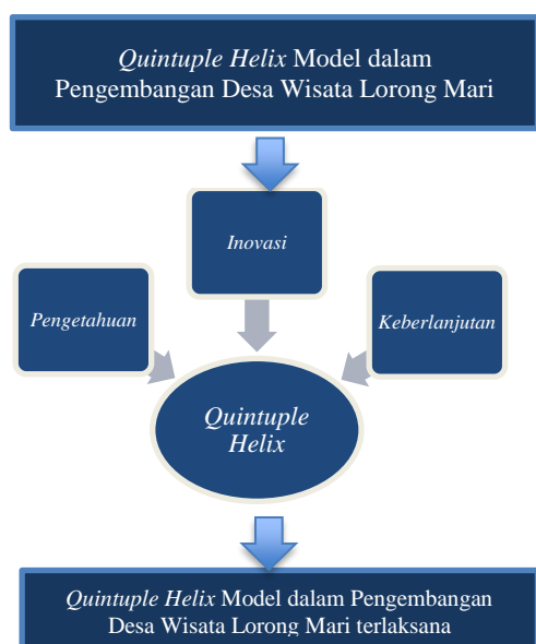
Gambar 2. Kerangka Pemikiran

Media adalah salah satu elemen dalam quintuple-helix selain pemerintah, sektor swasta, lembaga pendidikan tinggi, dan masyarakat. Media dapat membantu dalam mempromosikan potensi pariwisata dengan melibatkan unsur-unsur organisasi dan organisasi nirlaba untuk mewujudkan inovasi dengan menambahkan bahwa media adalah pemangku kepentingan yang memainkan peran penting dalam menginformasikan bisnis, termasuk mengembangkan bisnis, dan dalam mempromosikan bisnis. Media juga signifikan dalam mempromosikan pariwisata regional. Model quintuple-helix dalam pengembangan desa pariwisata perlu diperkuat melalui interaksi antara pemerintah, industri pariwisata, lembaga pendidikan tinggi, komunitas, media dan lingkungan. Interaksi sinergis di antara heliks yang layak dikembangkan sehingga desa pariwisata dapat dikelola secara lebih optimal [20].