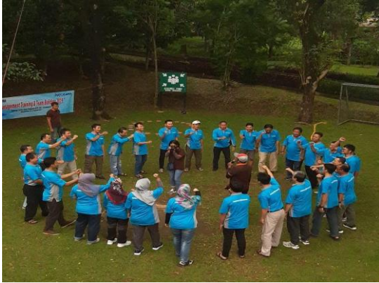
Gambar 6. Komunikasi Informal

setting yang lebih komunikatif. Salah satu contoh dari komunikasi informal ini ialah ketika para karyawan mengadakan training , gathering dan outbond , seperti yang berhasil dipotret pada dokumentasi berikut studi berikut ini.