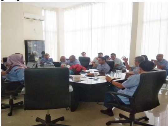
Gambar 4. Komunikasi Formal Karyawan PT Indorama Purwakarta

Komunikasi Formal ; komunikasi ini berlangsung secara struktural, sistematis, dan bersifat vertikal. Komunikasi ini biasanya terjadi dalam konteks pekerjaan yang prosedural. Salah satu bentuk dari komunikasi ini ialah instruksi dari atasan ke bawahan pada garis struktur manajerial pabrik. Kemudian misalnya komunikasi ini juga berbentuk koordinasi antara para pimpinan lini pabrik. Komunikasi formal ini cenderung normatif dan kaku, karena setiap komunikasi dan komunikator dibatasi oleh beberapa norma dan aturan sesuai dengan pembagian kerjanya. Contoh nyata dari komunikasi formal ini misalnya, pada saat rapat pimpinan, pengarahan, maupun evaluasi rutin. Berikut ini adalah salah satu gambaran suasana dari aktifitas komunikasi formal yang terjadi pada saat forum rapat dan pengarahan dari pimpinan kepada para pimpinan lini.