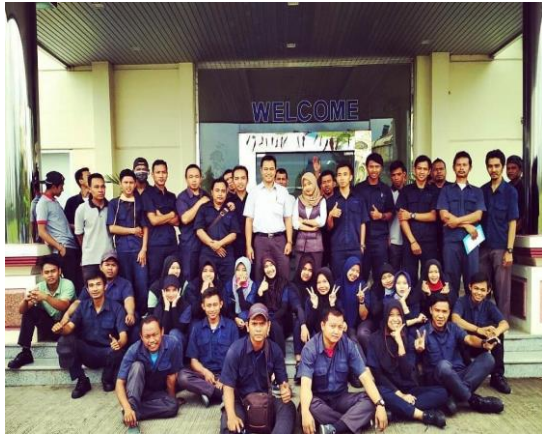
Gambar 2. Para karyawan PT Indorama sedang berfoto bersama