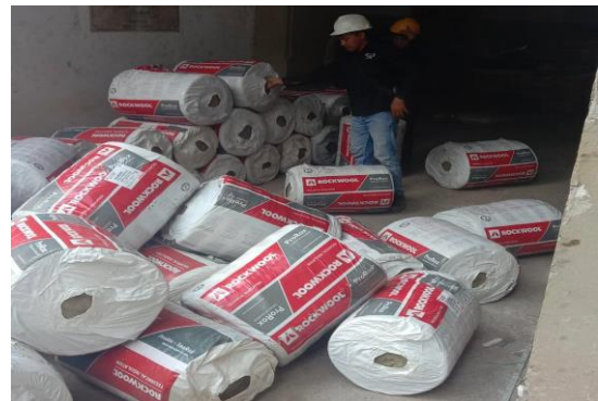
Gambar 3. Karyawan yang Sedang Melaksanakan Pekerjaannya

karyawan itu tinggal, menetap atau berdomisili. Selanjutnya, Gambar 3 berikut ini menunjukkan salah satu karyawan yang sedang melaksanakan pekerjaannya di pabrik PT Indorama Puwakarta.