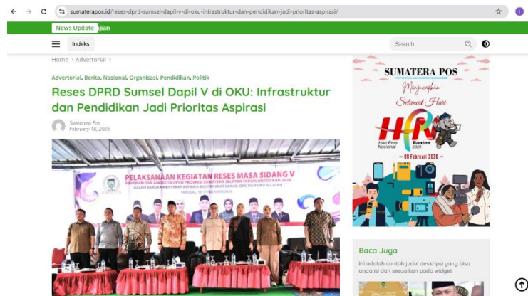
Gambar 4. Media Online Lokal Sumatera Pos