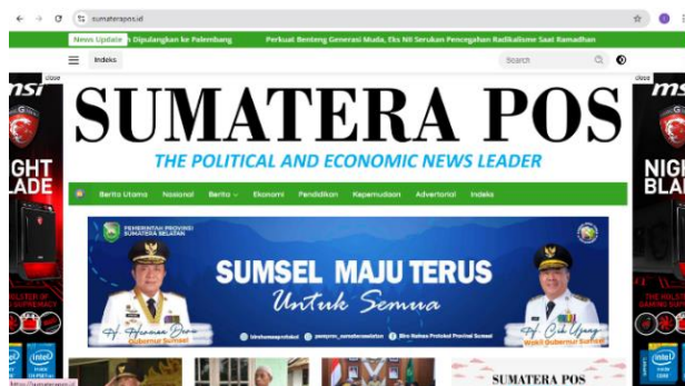
Gambar 1. Media Online Lokal Sumatera Pos

yang selaras dengan pola framing tersebut. Oleh karena itu, diperlukan kajian empiris untuk memahami bagaimana media online lokal membingkai isu-isu politik dan bagaimana konstruksi tersebut berpotensi memengaruhi opini publik.