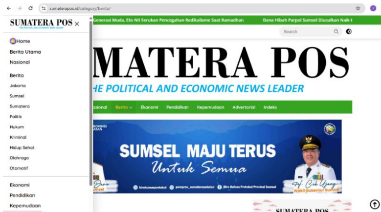
Gambar 2. Media Online Lokal Sumatera Pos

Tahap pertama dalam analisis framing Robert N. Entman adalah mengidentifikasi bagaimana media mendefinisikan suatu peristiwa sebagai “masalah”. Pendefinisian masalah menjadi elemen paling mendasar karena menentukan arah narasi, sudut pandang, serta fokus perhatian pembaca terhadap suatu isu politik. Dalam penelitian ini, analisis terhadap 28 berita politik yang dipublikasikan oleh Sumatera Pos menunjukkan bahwa konstruksi masalah tidak bersifat tunggal, melainkan terbagi ke dalam beberapa pola dominan. Adapun hasil penelitian yang di dapat yaitu Mayoritas berita (42,9%) membingkai isu politik sebagai bagian dari keberhasilan dan stabilitas pemerintahan daerah. Hal ini menunjukkan kecenderungan media dalam memosisikan realitas politik sebagai sesuatu yang terkendali dan progresif. Hal ini menunjukkan kecenderungan membingkai isu politik dalam konteks keberhasilan program serta stabilitas pemerintahan daerah. Pola ini terlihat dari cara peristiwa politik dipresentasikan sebagai bagian dari capaian pembangunan, penguatan tata kelola, maupun konsolidasi kelembagaan yang berjalan sesuai rencana. Isu-isu yang berpotensi dipersepsikan sebagai persoalan publik lebih sering direduksi menjadi tantangan administratif yang sedang ditangani secara sistematis oleh pemerintah. Dengan demikian, fokus pemberitaan tidak diarahkan pada potensi konflik atau ketegangan politik, melainkan pada narasi keberlanjutan dan kemajuan.