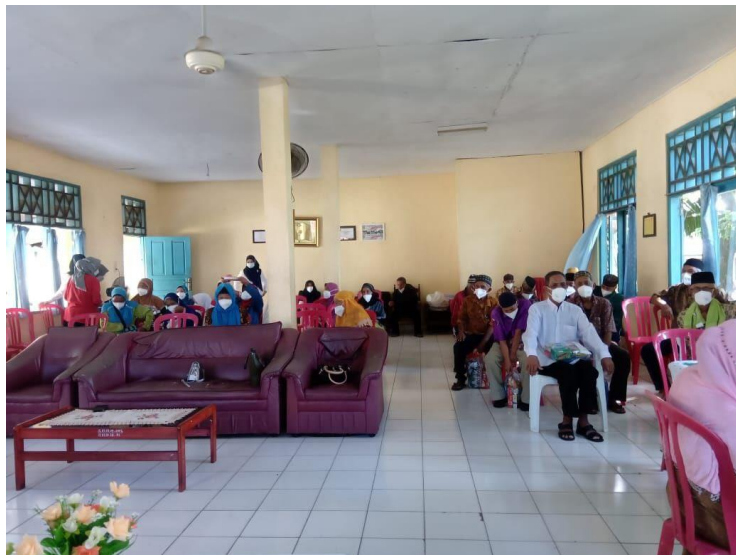
Gambar 2. Panti Sosial

Berbagai manfaat tersebut menjadi bagian sangat penting dalam program rehabilitasi sosial. Hal ini membantu klien membangun kembali harga diri, mengembalikan keberfungsian sosial, serta klien mampu menjalin hubungan yang baik dengan lingkungan sosialnya.