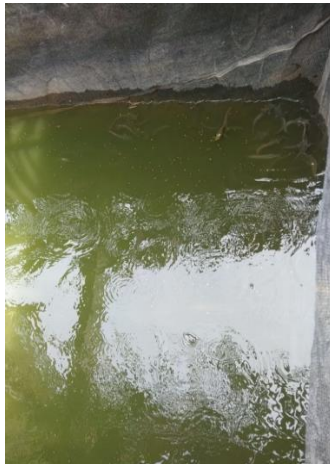
Gambar 1. Kolam Ikan Lele

Melalui pendampingan strategi pemasaran ikan lele ini diharapkan mampu memberikan dampak positif, serta merupakan salah satu usaha yang cukup potensial dalam meningkatkan kesejahteraan masyarakat. Permasalahan kurangnya strategi pemasaran yang baik dan terkait dukungan modal yang kurang memadai dalam usaha ikan lele untuk meningkatkan kesejahteraan masyarakat menjadi salah satu penghambat berkembangnya usaha tersebut, dimana dari 4 kelompok, bantuan awal pihak Kelurahan Sako Baru Kecamatan Sako adalah hanya sebanyak 500 ekor untuk tiap kelompok yang tergabung. Permasalahan lainnya juga terkait kurangnya pembinaan terhadap sumber daya manusia (SDM) anggota kelompok mengenai manajemen lanjutan dalam usaha budidaya ikan lele, disamping itu juga budidaya ikan lele kelompok masyarakat di Kelurahan Sako Baru Kecamatan Sako hanya dalam skala budidaya tradisional dengan sistem kolam galian tanah, seperti pada gambar dibawah