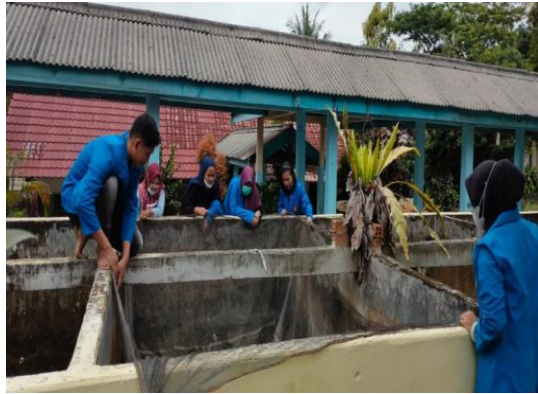
Gambar 4. Observasi di lapangan