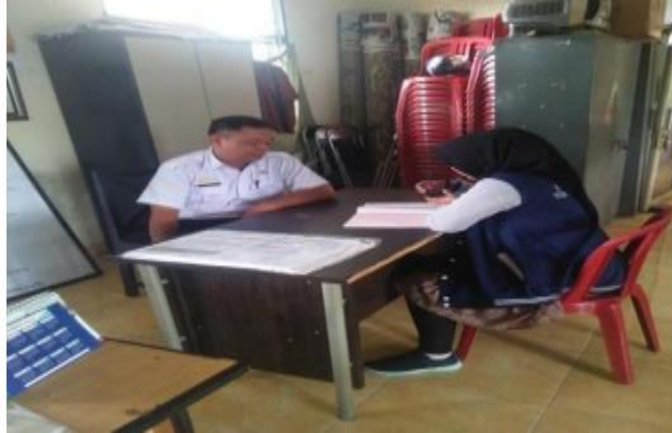
Gambar 2. Diskusi sebelum Pengabdian kepada Masyarakat

Kegiatan pengabdian kepada masyarakat ini difokuskan untuk melatih kemampuan ( softskill ) perangkat desa dan karang taruna untuk mendorong gotong royong meningkatkan kesejahteraan di desa. Permasalahan yang terlebih dahulu diselesaikan adalah memperbaiki tata cara berbicara para peserta di muka umum. Mengacu pada hasil identifikasi masalah yang dihadapi oleh mitra, maka tim pengabdian dapat memberikan solusi kepada peserta sebagai berikut: