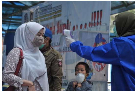
Gambar 3. Pengecekan suhu sebagai salah satu prosedur normal baru

Berdasarkan hal tersebut, Pemerintah Desa Sukaraja Baru, Kecamatan Indralaya Selatan, Kabupaten Ogan Ilir kini telah membekali setiap perangkat desa dan pengunjung dengan memindai kode QR di setiap pintu masuk dan keluar kantor. Setiap perangkat desa dan pengunjung harus memindai kode QR dengan aplikasi Pedulilindungi untuk mengetahui status vaksinasi ini.