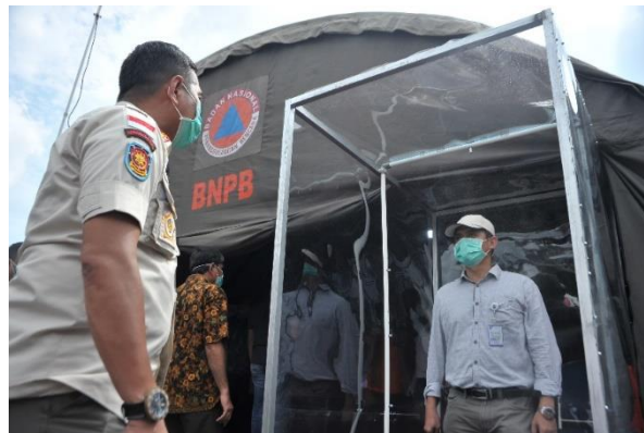
Gambar 2. Penggunaan bilik disinfektan pada awal pandemi Covid 19

Pemerintahan Desa Sukaraja Baru, beliau mengungkapkan saat ini di masa pandemi corona aktivitas perekonomian di desa berkurang jauh, akibat penerapan pembatasan kerumunan masa, maka untuk kegiatan pasar kalangan di batasi seminggu hanya satu kali, yang sebelumnya biasanya dua kali, kemudian untuk menggelar demo atau event kegiatan seperti pameran motor, ataupun produk-produk saat ini waktu kegiatan juga dibatasi, tidak boleh sering-sering melaksanakan kegiatan yang dapat memancing massa masyarakat untuk berkumpul dan berkerumun. Dampak dari itu semua terlihat lesunya roda perputaran perekonomian masyarakat.