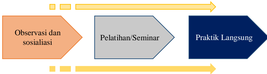
Gambar 2. Metode Pelaksanaan Pengabdian kepada Masyarakat