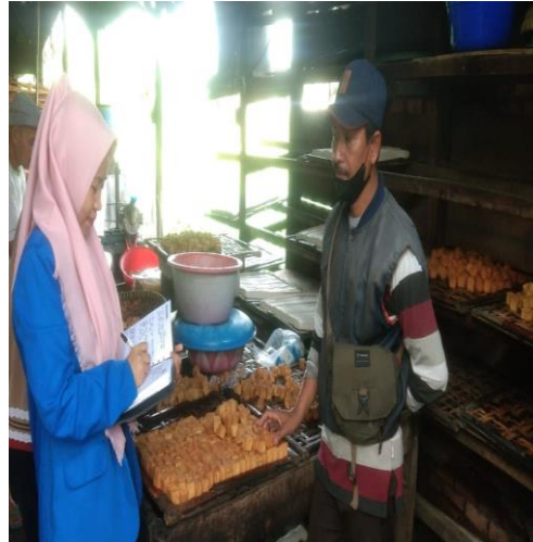
Gambar 2. Wawancara dengan informan

Berkaitan dengan peningkatan pendapatan bahwa dapat dikatakan belum stabil karna bahan baku pembuatan tahu masih mengalami harga naik turun, dengan demikian tingkat ekonomi belum maksimal. Seperti halnya satu hari bisa untuk 80 kg kacang kedelai yang menghasilkan 4000 tahu, di mana harga pertahu tahu per pcs Rp. 350 sedangkan harga kacang kedelai 1 Kg Rp. 12.000 (1 karung isi 50 Kg). Harga kayu bakar 1 truk Rp. 1.400.000 bisa untuk masak 1 ton kedelai. Usaha tahu telah didirikan sejak tahun 1992 sampai saat ini, artinya telah dikelola secara turun temurun. Adapun tingkat ekonominya dari tahun ke tahun meningkat, meskipun pada tahun 2000 banyak kenaikan bahan baku dalam pembuatan tahu seperti kacang kedelai, minyak sayur, kayu dan lainnya yang otomatis mengurangi angka profit. Akan tetapi dengan adanya pabrik tahu di wilayah ini sangat memberi manfaat terhadap masyarakat lokal selain memperoleh keterampilan dalam membuat tahu juga masyarakat dapat dengan mudah memperoleh tahu. Lebih lanjut, sisa proses produksi seperti ampas tahu dikelola kembali oleh masyarakat lokal dan dapat bernilai ekonomi dengan dijual kepada peternak sapi atau kambing sebagai bahan konsentrat penggumakan hewan.