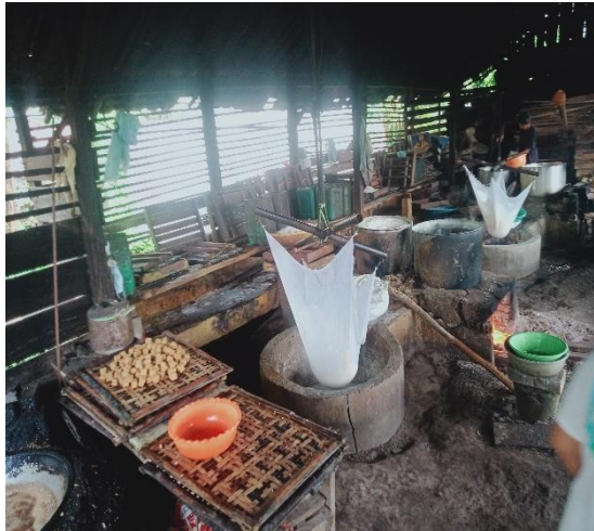
Gambar 3. Pabrik Tahu

Usaha tahu yang dijalankan oleh masyarakat Desa Pasir Putih memberikan dampak yang cukup baik, serta juga dapat mempengaruhi masyarakat lokal untuk mengkonsumsi tahu. Salah satu alasan masyarakat masih mengkonsumsi tahu adalah harganya yang ekonomis dan mudah diperoleh. Banyak manfaat yang diperoleh saat mengkonsumsi tahu salah satunya memenuhi kebutuhan gizi masyarakat. Selain itu produksi usaha tahu di Desa Pasir Putih tidak menimbulkan persaingan, karena adanya sistem gotong royong sesama masyarakat dalam produksi dan pemasaran. Seperti apabila salah satu rumah produksi tidak dapat menampung pesanan dengan jumlah yang berlebihan, maka pesanan lainnya dapat diteruskan kepada pengusaha tahu lainnya.