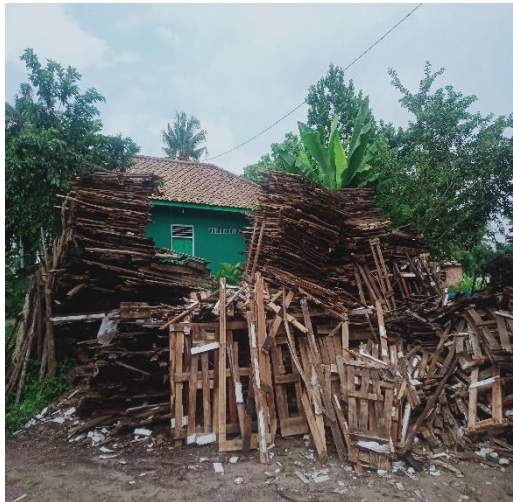
Gambar 4. Kayu bakar untuk membuat tahu