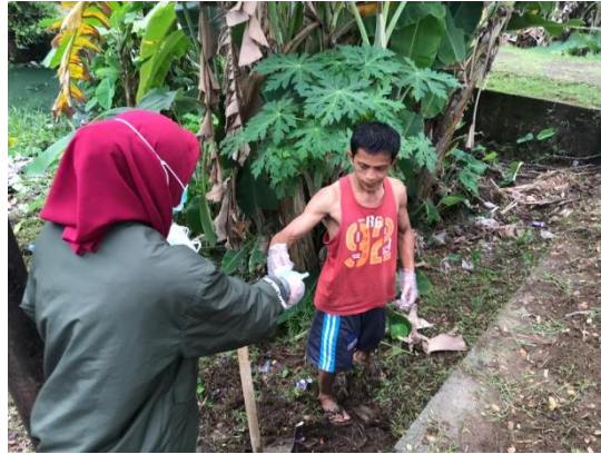
Gambar 4. Koordinasi bersama warga setempat

Gambar di atas memperlihatkan tim pengabdian sedang melaksanakan metode penyuluhan Pengelolaan Sampah dengan Pola 3R, berkoordinasi bersama warga dan remaja Masjid di Masjid Syariful Azhar RT 12 Kelurahan Sei Lais. Kegiatan lainnya yaitu dengan melaksanakan gotong royong mengumpulkan sampah plastik bersama Warga RT 13 Kelurahan Sei Lais.