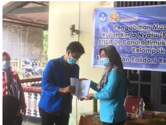
Gambar 5. Penyerahan Buku terkait 3R