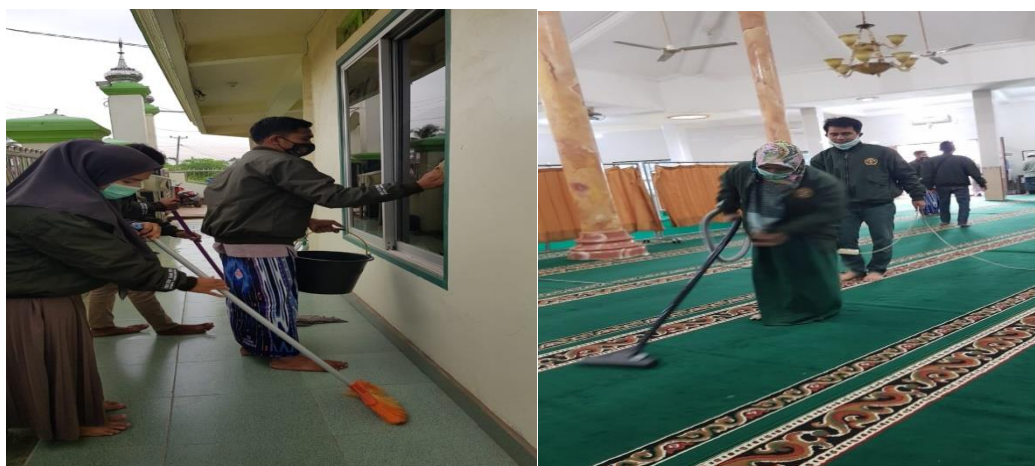
Gambar 5. Kerja Bakti dan Penyemprotan Disinfectan di Masjid Nurul Huda