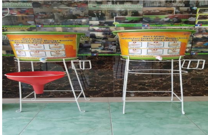
Gambar 6. Luaran Produk Pengabdian

Kegiatan pengabdian ini dengan membagikan hand sanitizer dan masker, serta dosen juga memasang poster untuk menyosialisasikan tentang protokol pencegahan Covid-19 dan kerja bakti di Masjid Nurul Huda Kalidoni serta bersama-sama membuat ember pencuci tangan di masjid Nurul Huda yang berada di Kelurahan Kalidoni. Selain itu, melalui sosialisasi yang dilakukan menghimbau kepada masyarakat khususnya jemaah masjid untuk selalu memperhatikan kebersihan lingkungan disekitar, sering cuci tangan, gunakan masker dan hand sanitizer serta tetap menjaga kesehatan dengan mengkonsumsi makanan bergizi.