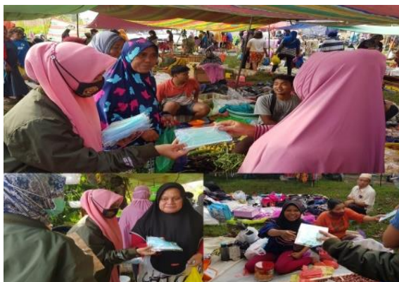
Gambar 4. Sosialisasi dan Pembagian perlengkapan pencegahan covid-19