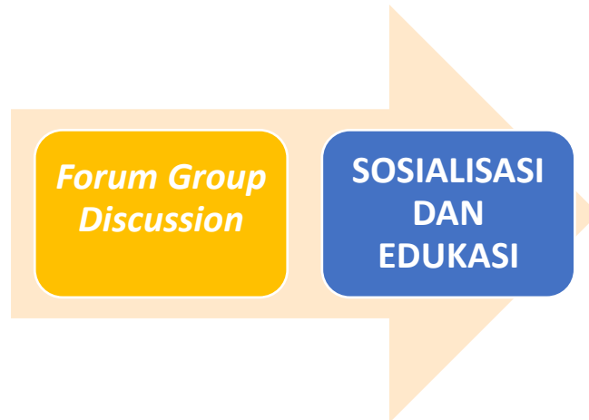
Gambar 2. Metode Pelaksanaan Pengabdian kepada Masyarakat