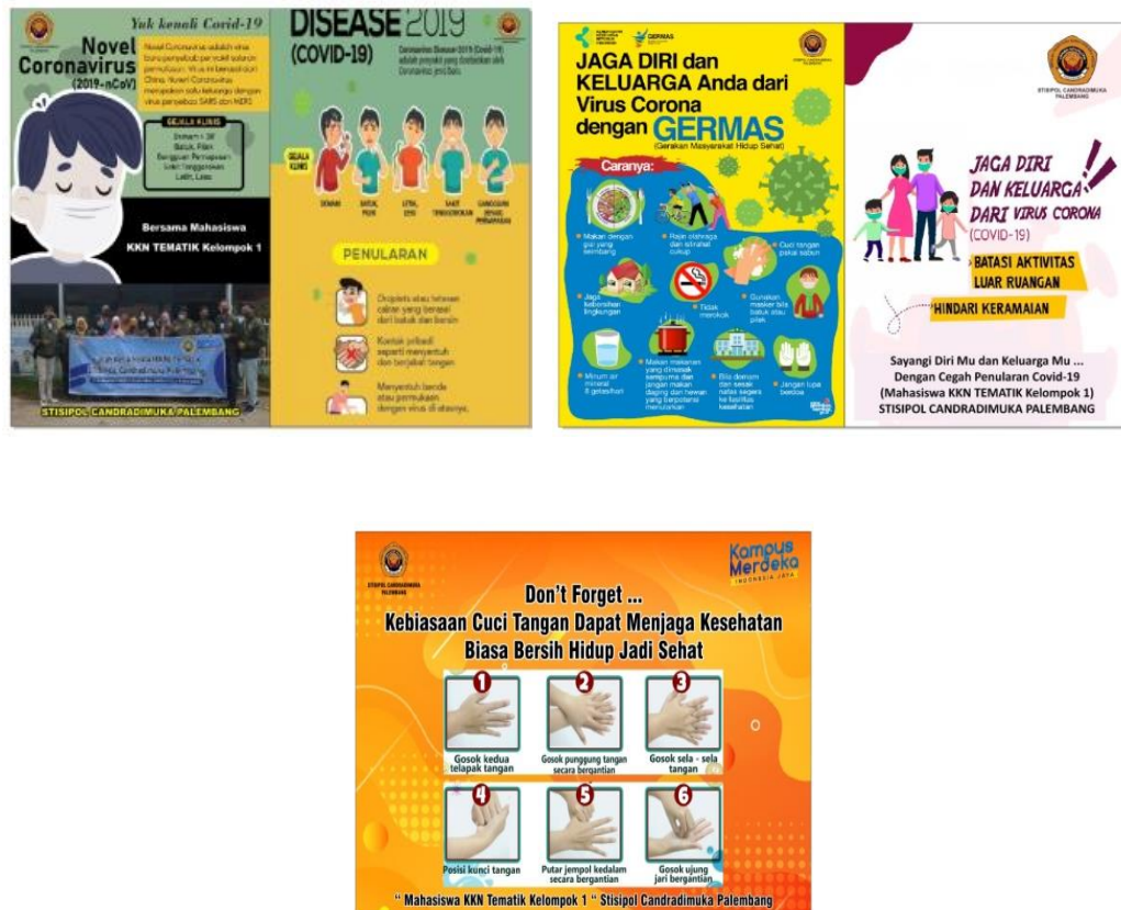
Gambar 3. Brosur dan Stiker Himbauan Tentang Protokol Kesehatan

Metode pelaksanaan untuk mencapai tujuan dari pengabdian masyarakat ini dalam mengatasi masalah masyarakat untuk menghadapi kondisi pademi covid 19 yang dilakukan oleh Tim Pengabdi dan mahasiswa Stisipol Candradimuka dengan melalui sosialisasi menciptakan lingkungan sehat dimasa pademi covid 19 dan pembagian masker, hand sanitizer , dan poster, di tempat usaha pengarajin Tahu, Pasar Kalangan di Kelurahan Kalidoni dan di masjid yang berada kelurahan Kalidoni Kota Palembang. Sosialisasi dilakukan kepada masyarakat dalam rangka membantu masyarakat untuk membiasakan diri menghadapi kondisi ini. Sosialisasi juga dilakukan untuk memberikan informasi guna meningkatkan pemahaman masyarakat saat menghadapi pademi covid 19, diharapkan masyarakat mematuhi protokol kesehatan yang berlaku karena sejatinya Covid-19 belum hilang dan masih menjadi pandemi di dunia.