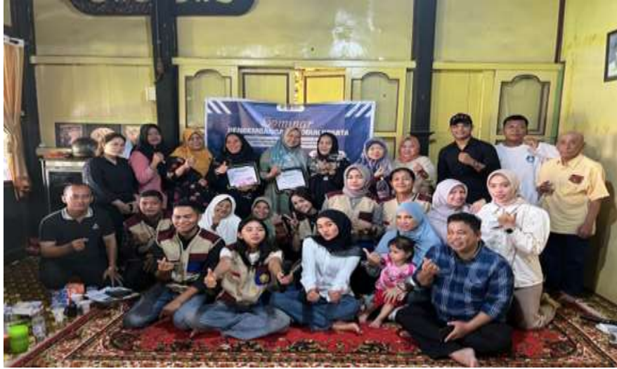
Gambar 5. Foto bersama peserta sosialisasi

Usai paparan materi, peserta diberi kesempatan untuk bertanya, baik kepada narasumber pertama atau kedua. Acara di akhiri dengan mencicipi kudapan dan foto bersama. Selain kegiatan Sosialisasi Pemanfaatan Media Sosial untuk Pemasaran dan Pengawasan Kebersihan Produk Pempek, dilakukan juga pemberian banner pada salah satu UMKM yang belum memiliki banner yaitu pembuat pempek “tinah”. Kegiatan terakhir, pemasangan plang nama lorong dan lokasi sentra pempek di depan lorong Kenduruan RW 12.