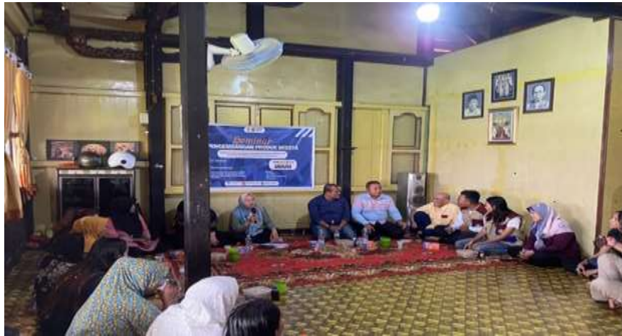
Gambar 3. Suasana Seminar yang dilakukan di kediaman Ketua RW 12 Kelurahan 7 Ulu

Pengawasan kebersihan produk kuliner sangat penting untuk mencegah terjadinya keracunan makanan dan memastikan konsumen mendapatkan produk yang aman dan berkualitas tinggi. Hal ini juga berperan dalam menjaga reputasi bisnis kuliner serta mematuhi peraturan kesehatan yang berlaku.