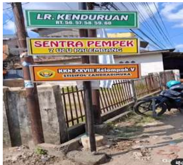
Gambar 6. Pemasangan banner “Pempek Ibu Tinah” dan Plang Lorong Kenduruan