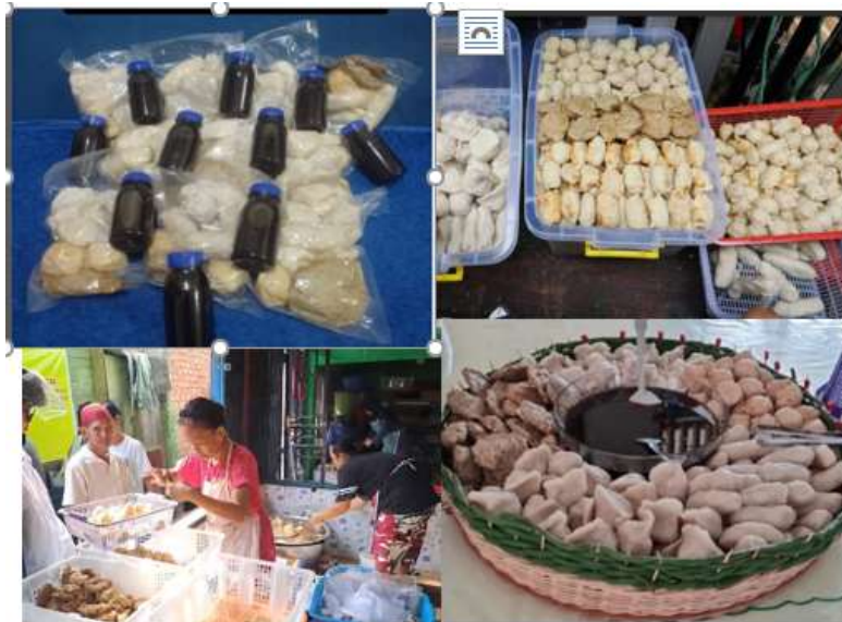
Gambar 2. Aneka pempek di 7 Ulu

Selain media sosial yang dipakai, menurut beliau perlu diperhatikan mutu makanan yang dijual agar pembeli selalu datang membeli dan pembeli dapat mempromosikan makanan yang dibelinya. Ibu Minah mempersilahkan para pelaku UMKM pempek yang ingin belajar pempek, silahkan datang ke rumahnya, akan diajari dan dibagi ilmu tentang pengelolaan pempek yang baik.