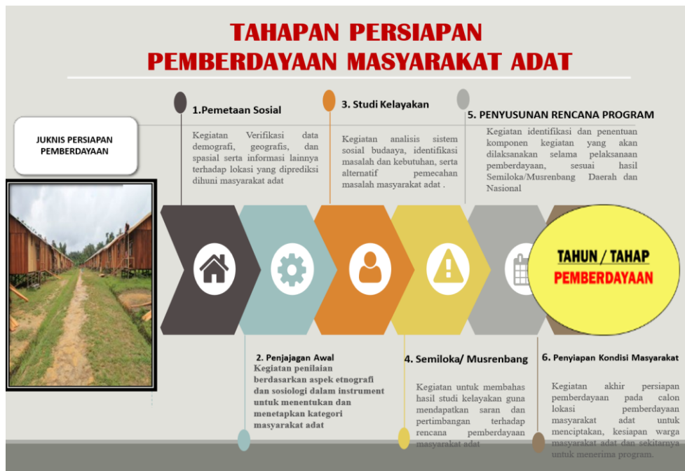
Gambar 4. Tahapan Persiapan Pemberdayaan Masyarakat Adat

Melalui kegiatan ini, pengurus Yayasan PAPEDA dibekali pemahaman mendalam terkait dengan tahapan persiapan yang harus dilakukan dalam melaksanakan kegiatan pemberdayaan KAT. Adapun tahapan tersebut diantaranya: