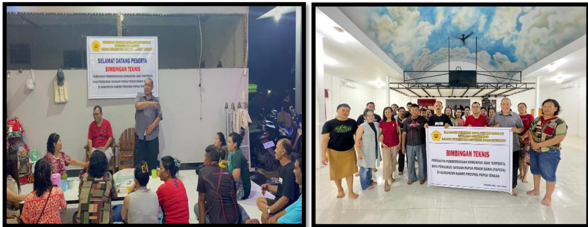
Gambar 2. BIMTEK Pengurus Yayasan PAPEDA

Kegiatan BIMTEK dilaksanakan di kantor Yayasan PAPEDA dengan dihadiri oleh pengurus yayasan dan turut berpartisipasi secara aktif dengan berbagi pengalaman dan memperdalam pemahaman mengenai pemberdayaan komunitas adat. Berikut hasil dokumentasi pemaparan materi pada kegiatan BIMTEK di Yayasan PAPEDA.