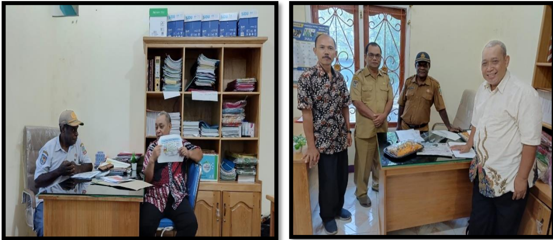
Gambar 1. Sharing Session di Dinas Sosial

sharing session (sesi berbagi) dengan staf dan juga dilakukan di Yayasan PAPEDA, serta dilaksanakan di lingkungan suku Yaur.