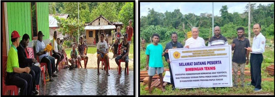
Gambar 3. Kegiatan Sosialisasi dan Bintek Persiapan PKAT di Suku Yaur

Melalui kegiatan ini, pengurus Yayasan PAPEDA dibekali pemahaman mendalam terkait dengan tahapan persiapan yang harus dilakukan dalam melaksanakan kegiatan pemberdayaan KAT. Adapun tahapan tersebut diantaranya: