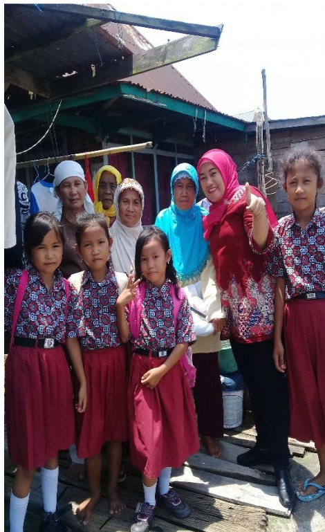
Gambar 1. Anak SD Penerima KIP

Penyaluran bantuan program Indonesia pintar di Kec. Sirah Pulau Padang Kab. OKI telah didistribusikan kepada masyarakat penerima bantuan. Didalam pelaksanaan dilapangan ada beberapa permasalahan yang ditemukan ada penerima bantuan yang orang tuanya tergolong mampu karena penerima program ini sama juga dengan penerima program pemerintah lainnya seperti PKH. Networking adalah upaya membangun koneksi dengan sebanyak mungkin orang atau perusahaan, yang dapat memberikan keuntungan satu sama lain dalam hubungan profesional atau bisnis. Keuntungan yang dimaksud di sini bukan semata-mata hanya bersifat transaksi langsung dalam bentuk materi, namun juga termasuk keuntungan dalam jangka panjang, misalnya referensi bisnis, akses informasi, peluang kolaborasi, dan sebagainya.